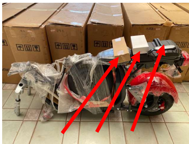
Espejos Cargador Respaldo